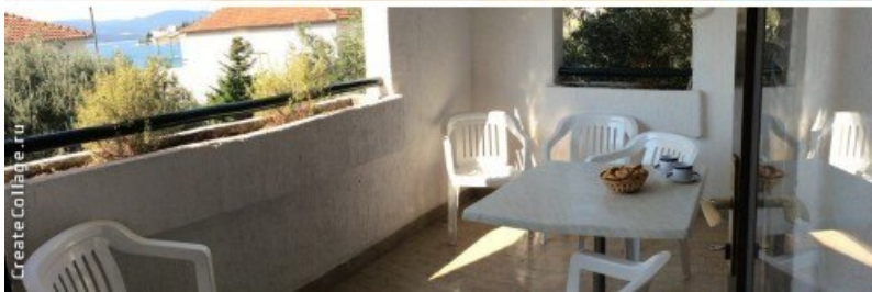
Бунгало в туристическом комплексе в Клек