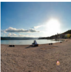
Альпы + море Хорватии