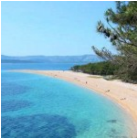
Отдых в Хорватии